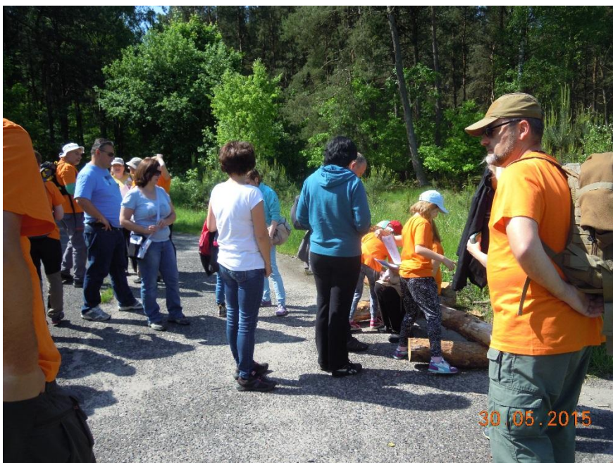
Na punkcie startu etapu dziennego

Po ukończeniu nocnego etapu i krótkiej przerwie na przebranie się, rajdowicze poszli bawić się na salę taneczną przy udziale DJ. Trzeba przyznać, że zabawa była udana, bo najwytrwalsi bawili się do czwartej nad ranem. Po krótkiej drzemce, obudził nas piękny, słoneczny dzień. Po zjedzeniu śniadania, drużyny przewieziono sukcesywnie autokarem do lasu na punkt startu etapu dziennego.