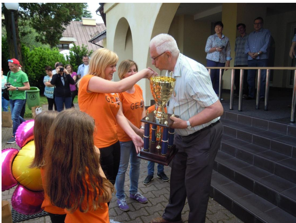
Puchar Głównego Geodety Kraju odbierają przedstawicielki Klubu Geodety SGP Warszawa

I miejsce i Puchar Głównego Geodety Kraju: Klub Geodety SGP Warszawa (146 pkt. pkt.)