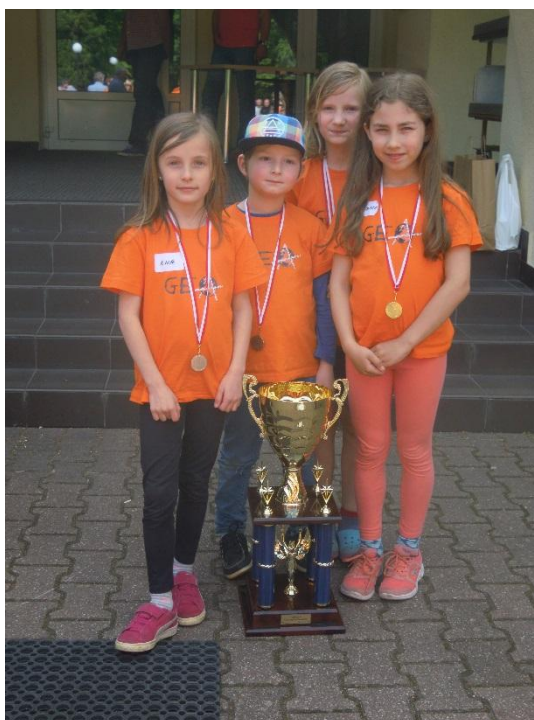
Mali zwycięzcy z Pucharem Głównego Geodety Kraju