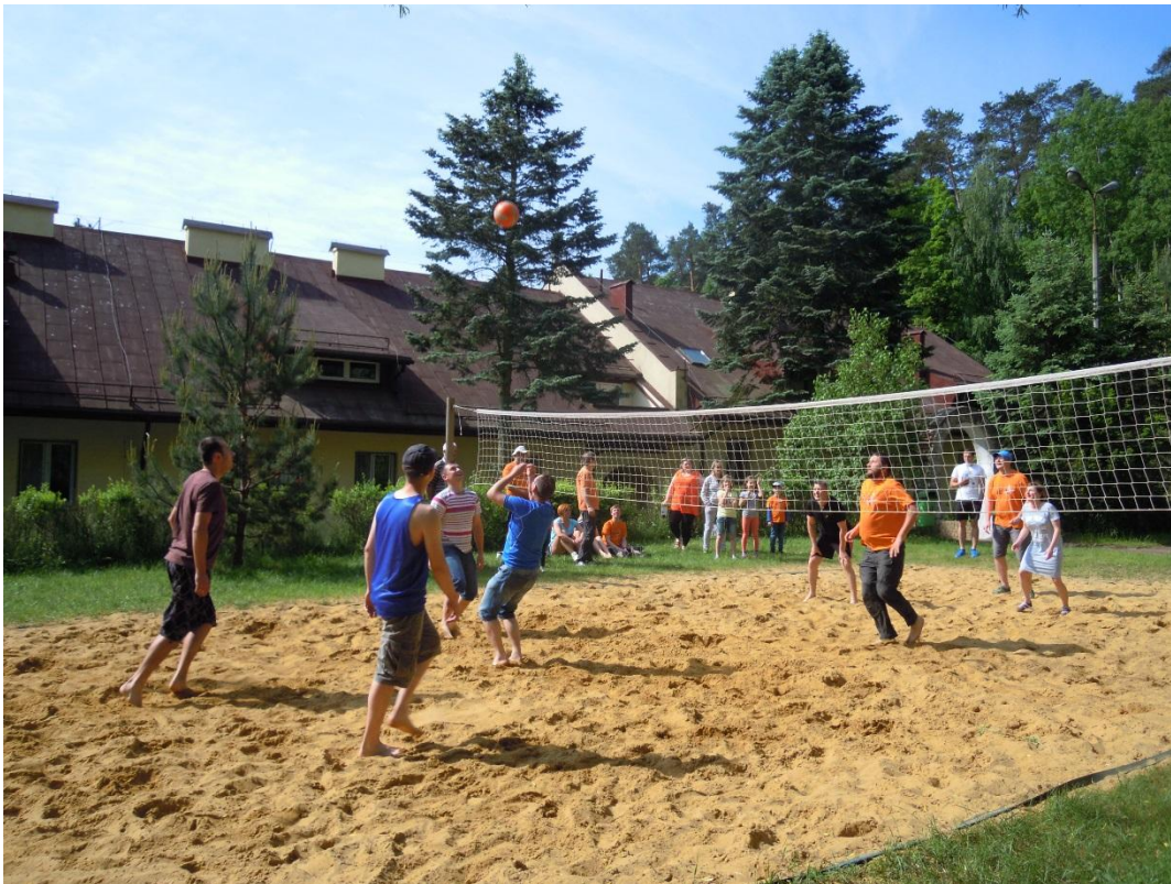
Mecz w siatkówkę

Zaś wieczorem odbyło się wspólne biesiadowanie pod zadaszonym miejscem grillowym, z pieczeniem kiełbasek w ognisku, wokół którego tańczono przy muzyce mechanicznej. Wiele osób wytrzymało przy stołach, rozmowach, toastach i tańcach do rana, kiedy wstawała jutrzienka zapowiadając pogodną i słoneczną niedzielę.