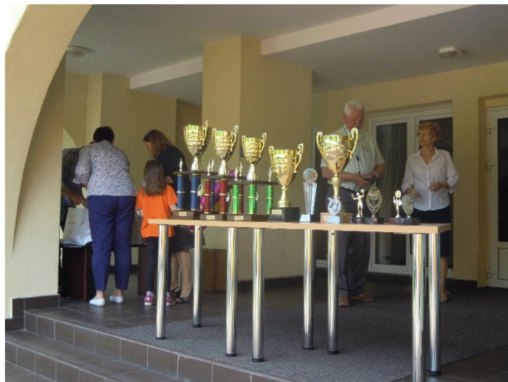
Puchary dla zwycięzców

Po zakończonej rywalizacji z niecierpliwością oczekiwano na poobiednie ogłoszenie wyników. Ostatecznej klasyfikacji dokonano w kategorii: drużynowej, instytucji i poszczególnych konkurencji sportowych.