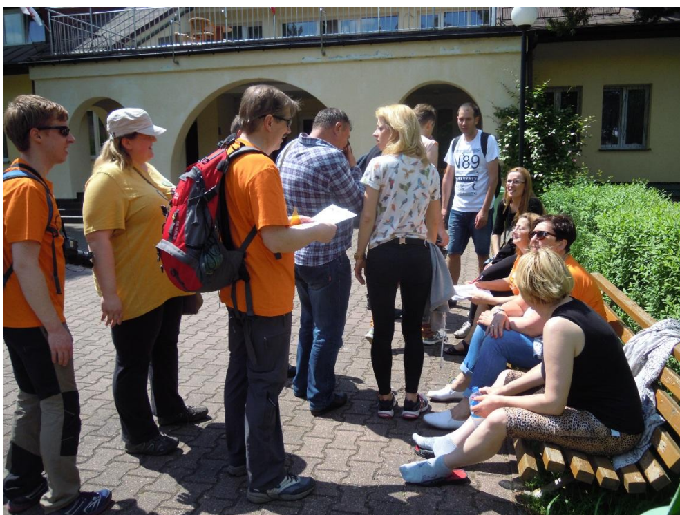
Meta etapu dziennego znajdowała się na terenie ośrodka wypoczynkowego „Zacisze” w Spale.

Na poprawne zaliczenie każdego etapu składało się przejście go w określonym czasie wraz z wykonaniem wszystkich zadań.