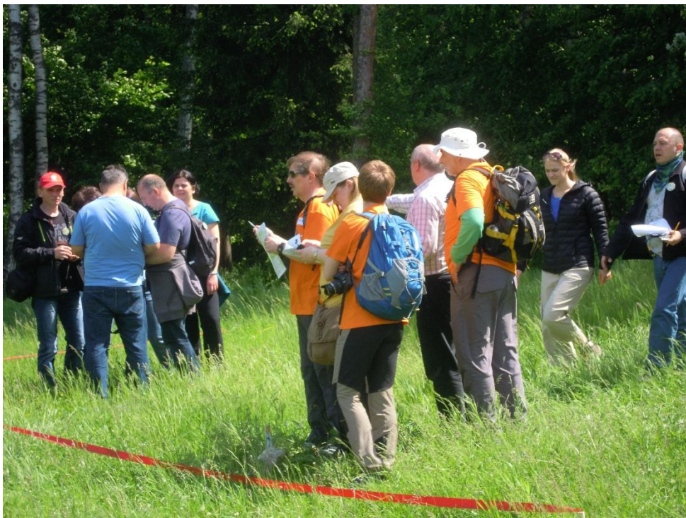
Wykonywanie pomiarów - obliczanie wyników

Na trasie należało spodziewać się także „zawodowego” egzaminu. Na czym on polegał? We wskazanym przez organizatora miejscu znajdowała się grupa ponumerowanych i oznakowanych drzew i palików. Egzamin przewidywał: określenie odległości między wskazanymi punktami oraz określenia wartości kąta utworzonego przez wskazane punkty (metodą na „oko”).