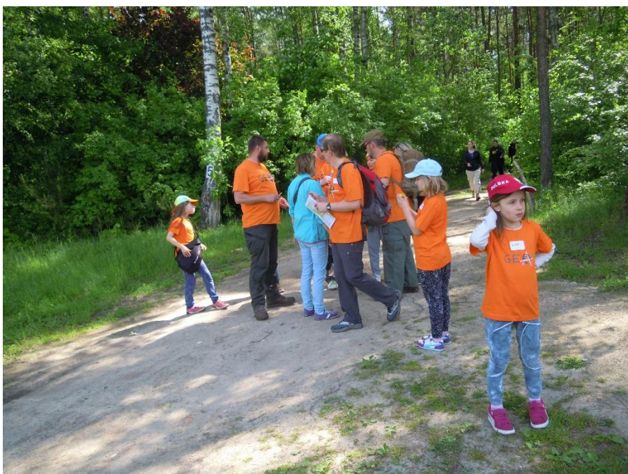
W którą stronę idziemy?

Trasę etapu dziennego liczącą ok. 10 kilometrów należało pokonać jednostajnym marszem z wyznaczoną prędkością 3,6 km / godz. Każda drużyna otrzymała opis trasy do przejścia wraz z załączoną na odwrocie mapą w skali 1:25000. Wyznaczono dodatkowy czas 5 minut na wniesienie punktów trasy na mapę oraz 2 minuty na wykonanie zadań geodezyjnych. Wskazane punkty od 1 do 12 pokazywały miejsca, które należało przejść po kolei na trasie etapu i wkreślić je na załączoną mapę. Część punktów określona została współrzędnymi geodezyjnymi (oś X skierowana na północ – oś Y skierowana na wschód), dla innych punktów ich lokalizacja opisana została w uwagach ( np. pkt. 7 – mostek na rzece Gać).